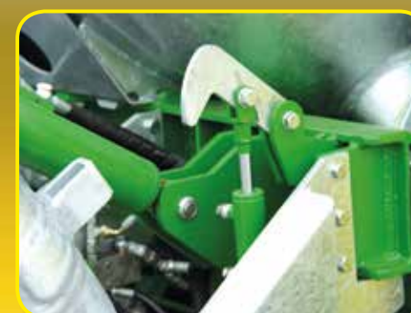
Gancio di sicurezza tubo pesca