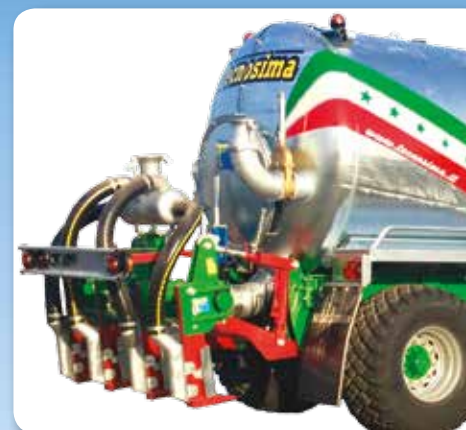
INTERATTORE 4 ANCORE AUTODIREZIONALE