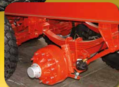
Sospensione a balestra parabolica