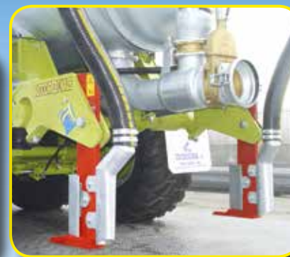
Interattore a 2 ancore autodirezionali