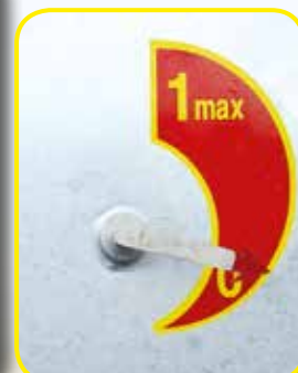
Livello carico cisterna