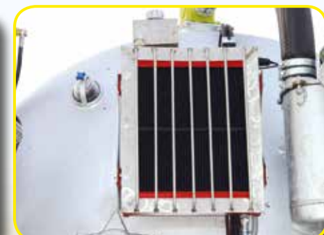
Raffreddamento a liquido