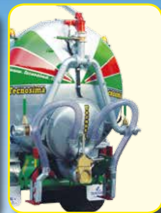
Gruppo garda con irrigatore movimento idraulico 5"