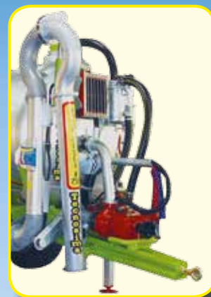
Pesca Idraulica Ø 200/300

Capacità da Lt. 5.000 a Lt. 12.000 Omologato da Kg. 6.000 a Kg. 11.000 capacità cisterna a richiesta sospensioni a balestra