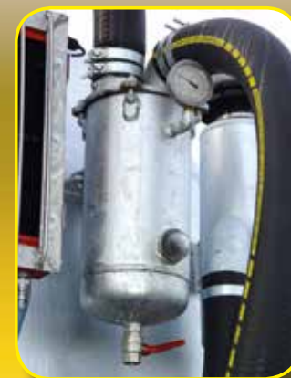
Doppia valvola troppo pieno