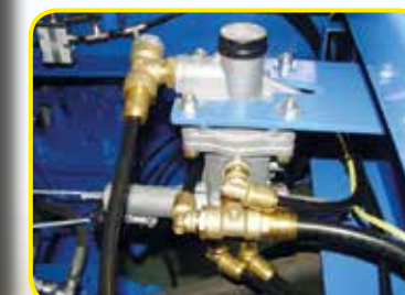
Correttore di frenata