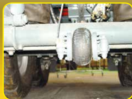
Correttore di sterzata