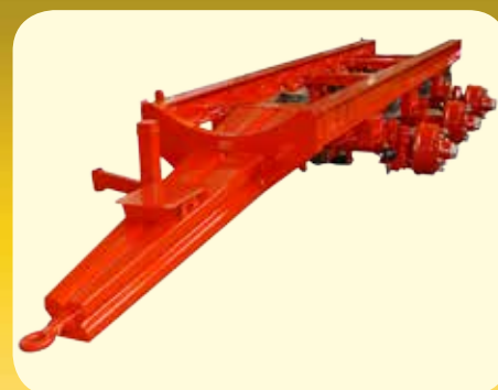
Telaio in acciaio al carbonio alta resistenza C45