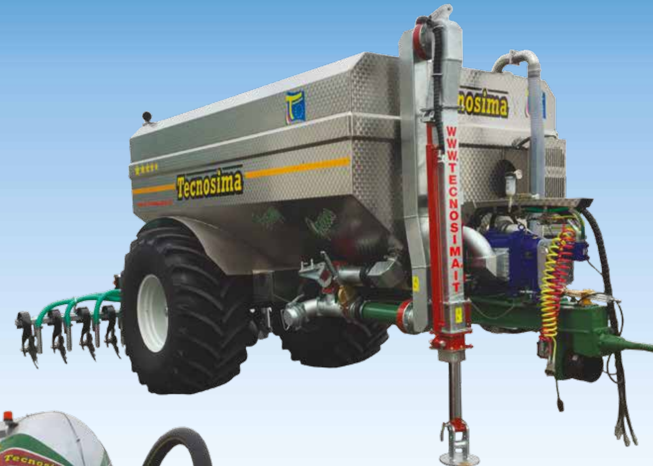
BARRA 12 ANCORE