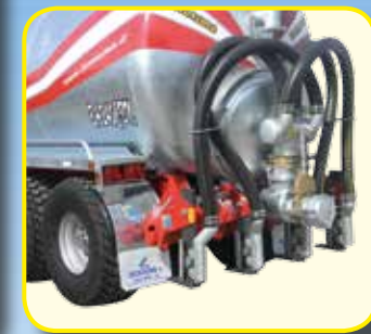
Interamento 4 ancore autodirezionale