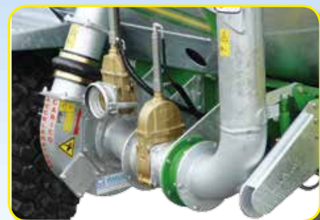
Acceleratore di carico