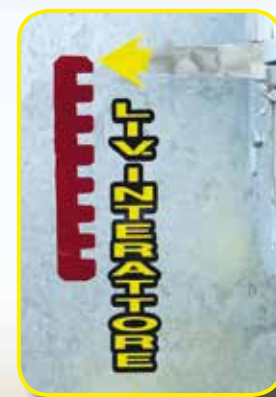
Segnalatore di profondità interattore