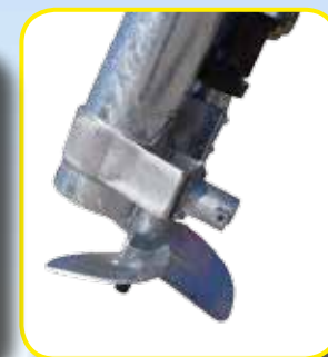
Elica tritattutto Miscelatrice