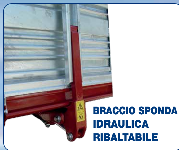
BRACCIO SPONDA IDRAULICA RIBALTABILE